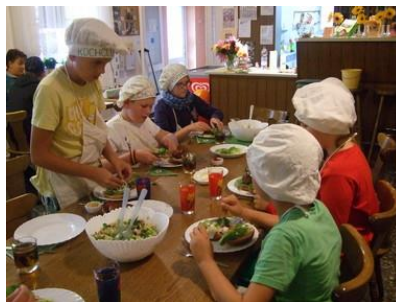
(Bild oben links – Seniorenmodenschau; Bild oben rechts – Fotokurs; Bild unten – Kinderkochschule)

Die Ferienzeiten – für viele Eltern ja bekanntlich die schwierigste Zeit in Hinblick auf eine Betreuung bzw. Beschäftigung ihres Nachwuchses. „Da haben wir hier in Parchim die Regelung, dass in den Sommerferien drei Einrichtungen aus der Stadt jeweils zwei Wochen Ferienspiele veranstalten, so dass die komplette Zeit der Sommerferien abgedeckt wird“, berichtet die Leiterin. „Und bei uns ist immer die „Bude“ voll wie man so schön sagt.“